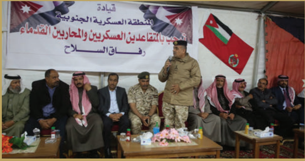
المساعد للتخطيط والتنظيم والموارد الدفاعية يشارك المتقاعدين العسكريين مأدبة إفطار في قيادة المنطقة العسكرية الجنوبية