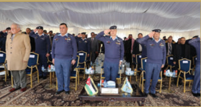
اختتام يوم تدريبي في مديرية الدفاع الجوي