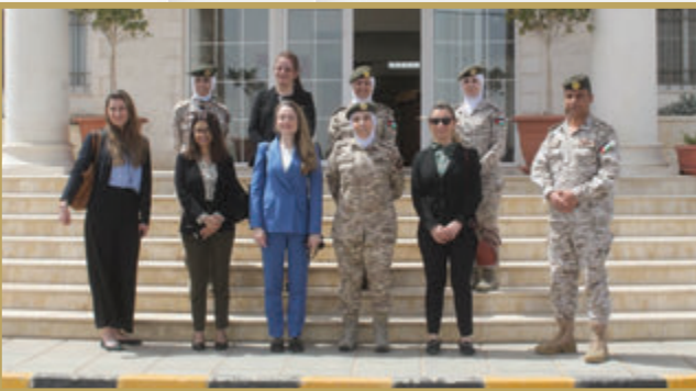
وفد من الأمم المتحدة يزور مركز تدريب المرأة العسكرية