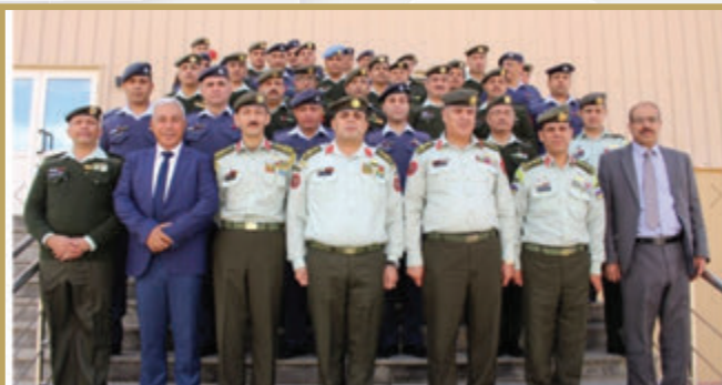
تخريج دورتي الإدارة التأسيسية للضباط وموارد الدفاع في مدينة سمو الشيخ محمد بن زايد آل نهيان التدريبية