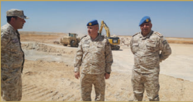
مدير سلام الهندسة الملكي يتفقد مشروع العمري