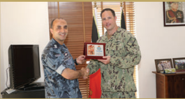
وفد عسكري أمريكي يزور قيادة القوة البحرية والزوارق الملكية