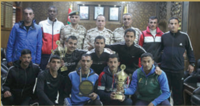
قائد المنطقة العسكرية الشرقية يُكرم الحاصلين على المراكز الأولى في بطولتي الماراثون وتنس الطاولة على مستوى القوات المسلحة