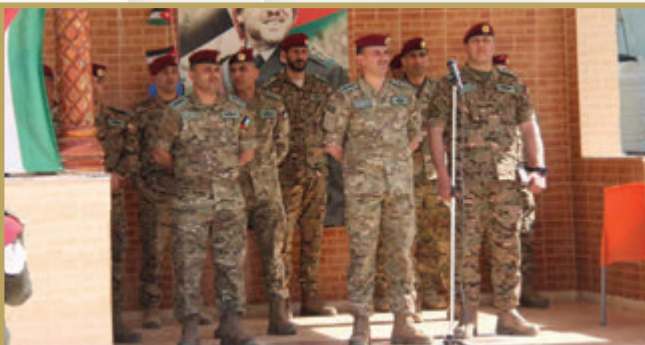
تخريج دورة المستجدين في مدرسة الأمير هاشم بن الحسين للقوات الخاصة