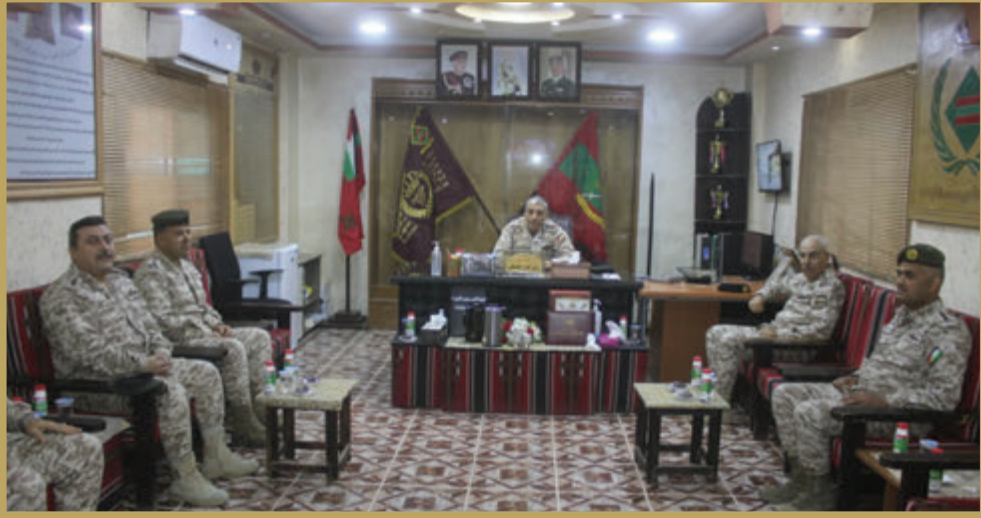
المساعد للعمليات والتدريب يزور كتيبة الأمير محمد الآلية/٩