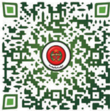
الوفاء و البيعة الدكتورة ماجدة ابو جاموس