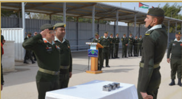
تخريج دورة مستجدين في مدرسة الملك طلال العسكرية