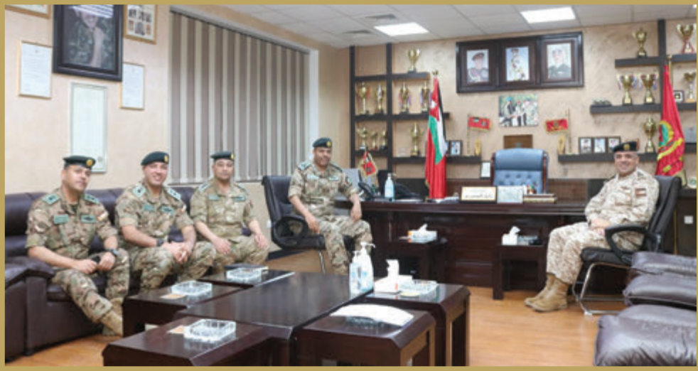
المساعد للتخطيط والتنظيم والموارد الدفاعية يشارك مرتبات لواء الملك حسين بن علي مأدبة الإفطار