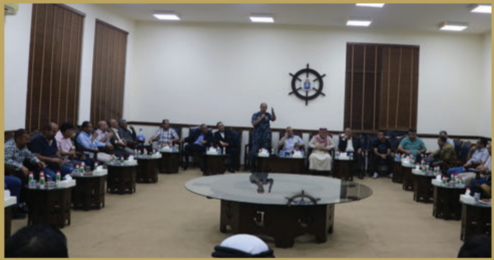
قيادة القوة البحرية والزوارق الملكية تقيم مأدبة إفطار للمتقاعدين العسكريين