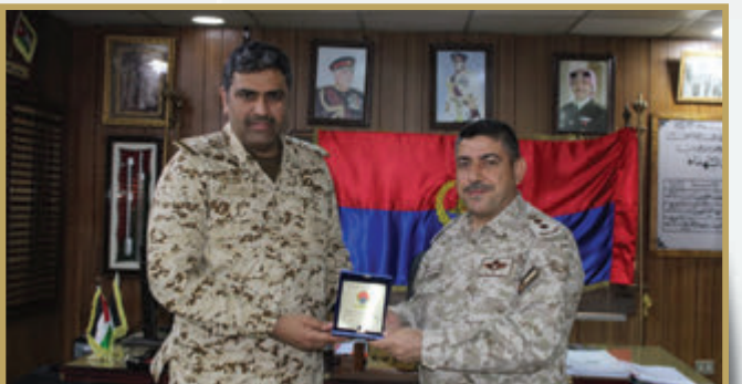
الملحق العسكري البحريني يزور مدرسة سلام المدفعية الملكي