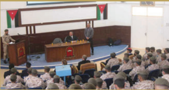
وفد بريطاني يُقيم ورشة عمل مشتركة في كلية العلوم الشرطية