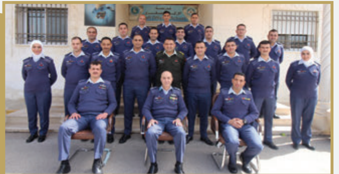
تخريج دورة الضباط التأسيسية رقم (٧٧) في قيادة سلاح الجو الملكي