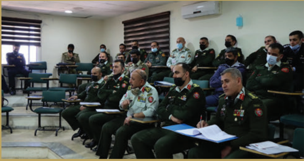
كلية القيادة والأركان تنظم ندوة بعنوان «دراسة الحالة»