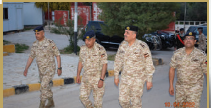
المساعد للتخطيط والتنظيم والموارد الدفاعية يزور كتيبة المدفعية ٩/ الملكية