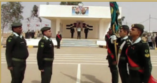
تسليم أعلام في قيادة لواء الشهيد وصفي التل الآلي/٢