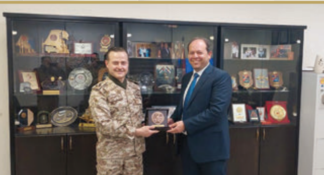
مدير الأمن السيبراني وتكنولوجيا المعلومات يُكرم أحد الضباط المتقاعدين