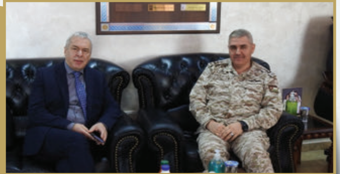
مدير المركز الدولي للأمن والسلامة الكيماوية يزور مديرية سلام الهندسة الملكي