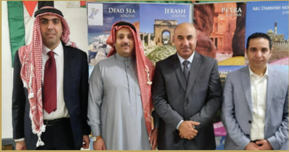
الملحق العسكري الأردني في بريطانيا يشارك طلاب كلية القيادة والأركان باليوم الوطني