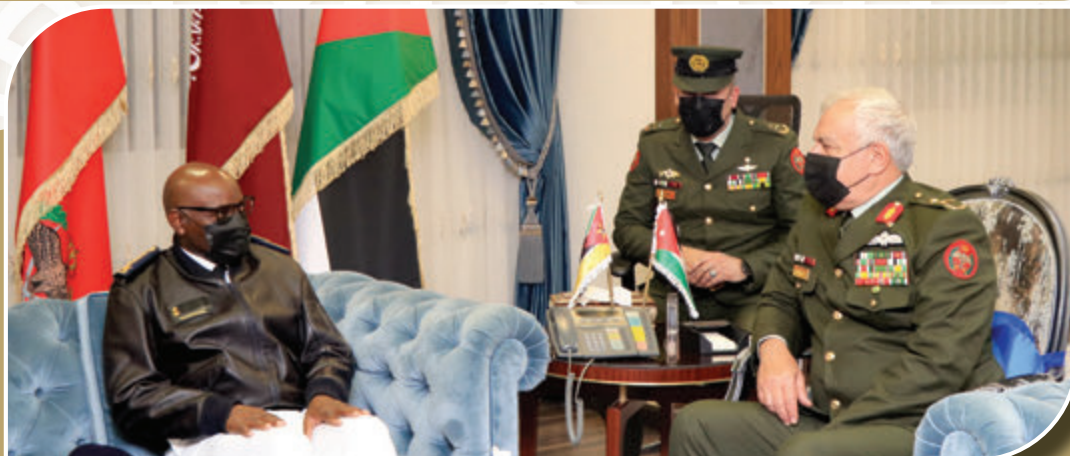
رئيس هيئة الأركان المشتركة يستقبل نظيره رئيس هيئة الأركان العامة لقوات الدفاع الموزمبيقية الأدميرال جواكيم مانغراس يوم الثلاثاء الموافق ٢ نيسان ٢٠٢٢