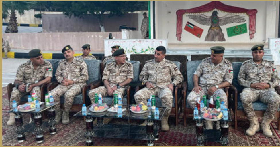
المفتش العام للقوات المسلحة يشارك كتيبة جعفر بن أبي طالب الآلية/ ٣٩ مأدبة الإفطار