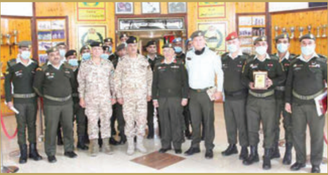
تخريج دورة المسعف التعبوي الميداني في قيادة المنطقة العسكرية الوسطى