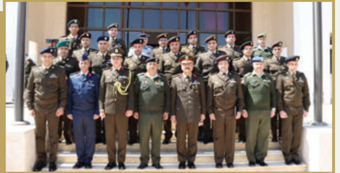
وفد عسكري مصري يزور كلية القيادة والأركان