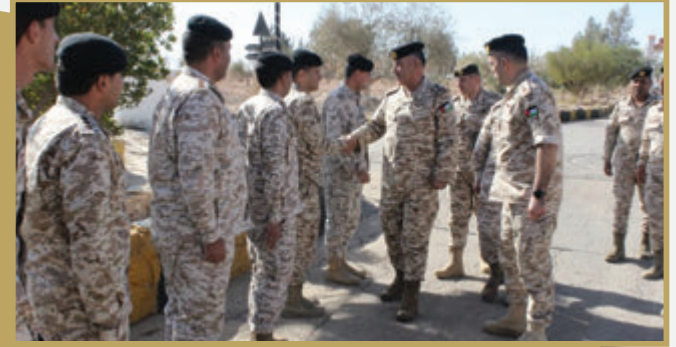
المساعد للإدارة والقوى البشرية يزور كتيبة الدبابات/٣ الملكية