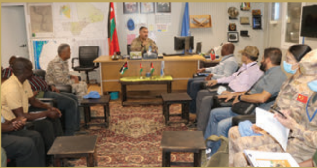
فريق التفتيش في قيادة الأمم المتحدة يزور قيادة قوة الإنتشار السريع الأردنية مالي/٢