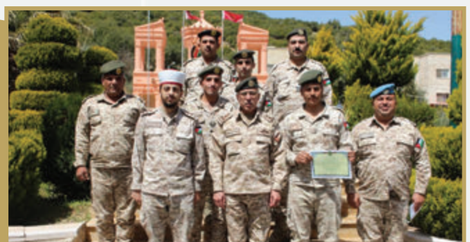
تخريج دورة حفظ القرآن التمهيدية رقم/٥ في قيادة المنطقة العسكرية الشمالية