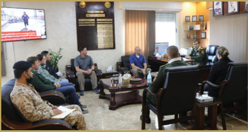
وفد من جامعة كولورادو يزور مركز التخطيط المشترك والدروس المستفادة