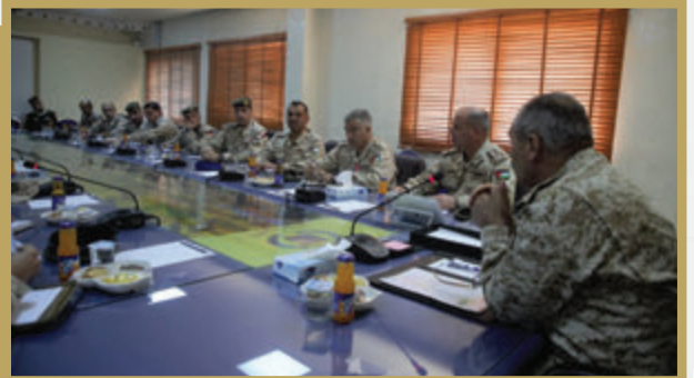
اجتماع تنسيقي في قيادة المنطقة العسكرية الجنوبية