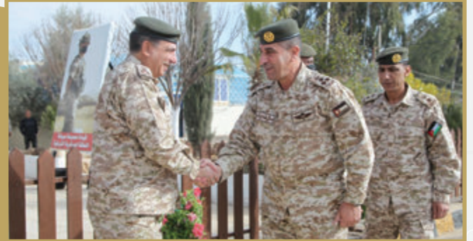
المفتش العام للقوات المسلحة يزور مجموعة صيانة المنطقة العسكرية الشرقية