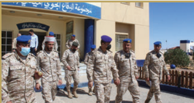
مدير الدفاع الجوي الميداني الملكي يزور مجموعة الدفاع الجوي الميداني /٣ الملكية