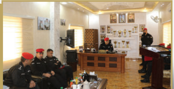
قائد الشرطة العسكرية الملكية يتفقد مجموعة الشرطة العسكرية الملكية/ عمان