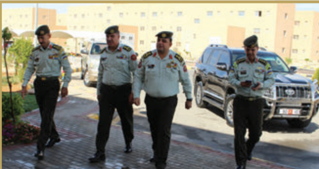
مدير مدينة سمو الشيخ محمد بن زايد آل نهيان التدريبية يتفقد المدارس داخل المدينة