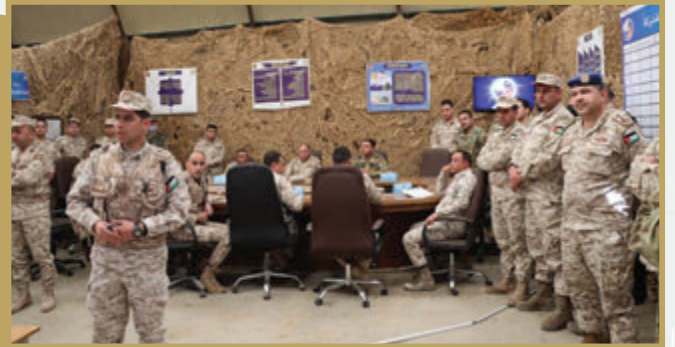
كلية القيادة والأركان تتابع تمرين «الرد الحاسم»