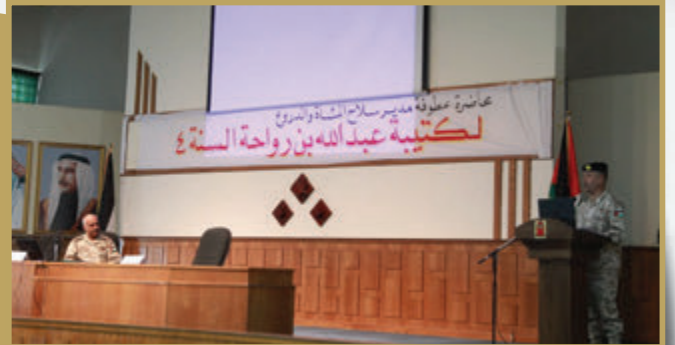
مدير سلام المشاة والدروع يحاضر في كلية العلوم العسكرية