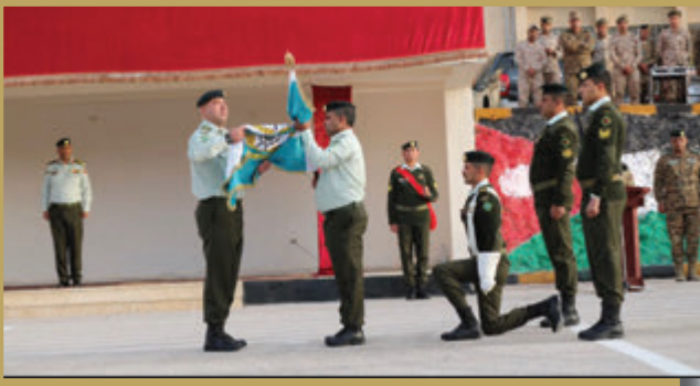
استلام وتسليم أعلام في إحدى كتائب لواء الملك حسين بن علي