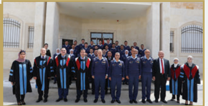
حفل تسليم شهادات البكالوريوس في كلية سلاح الجو الملكي الجامعية التقنية لعلوم الطيران