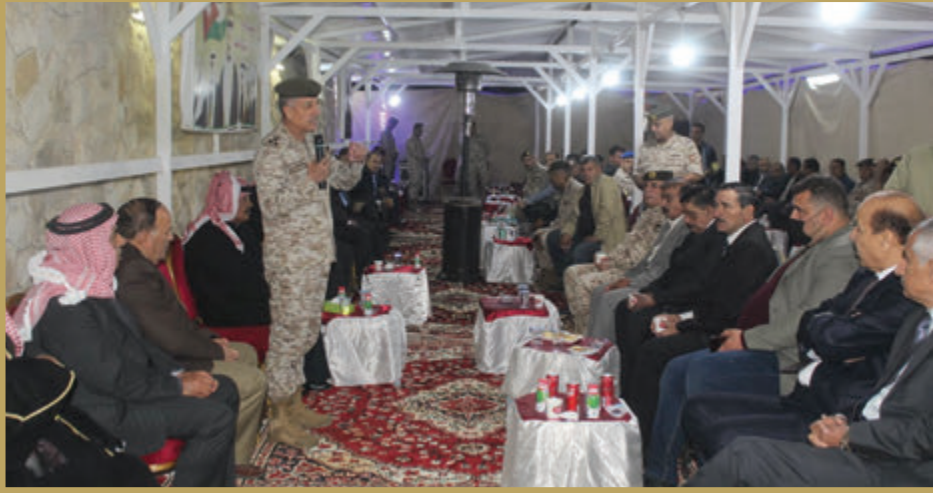
المساعد للعمليات والتدريب يشارك المتقاعدين العسكريين وذوي الشهداء مأدبة إفطار في قيادة المنطقة العسكرية الشرقية