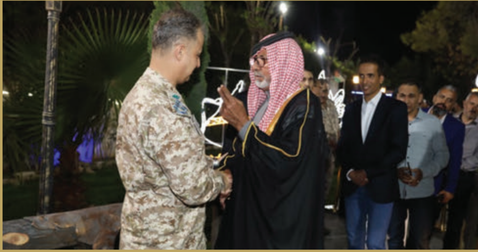
قيادة سلاح الجو الملكي تقيم مأدبة إفطار للمتقاعدين العسكريين والمحاربين القدامى وذوي الشهداء