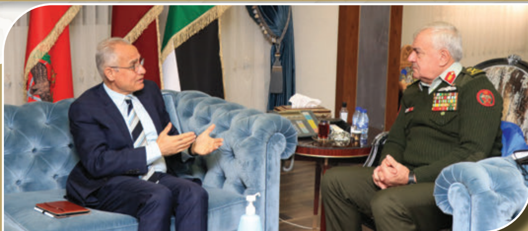
رئيس هيئة الأركان المشتركة يستقبل السفير البولندي لوكجان كاربينسكي يوم الاربعاء الموافق ٢٣ آذار ٢٠٢٢