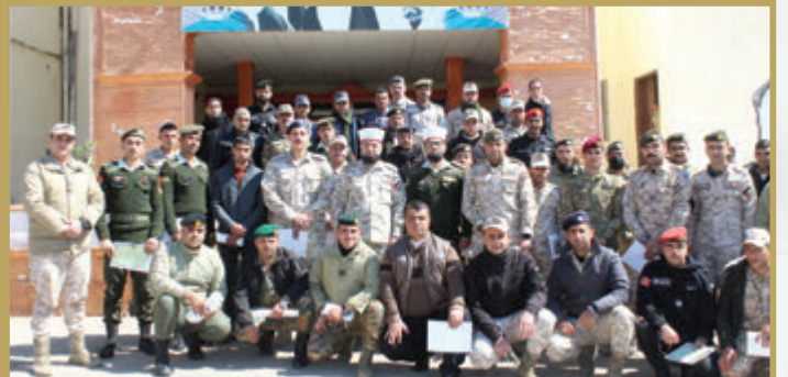
تخريج عدد من الدورات في كلية الأمير الحسن للعلوم الإسلامية