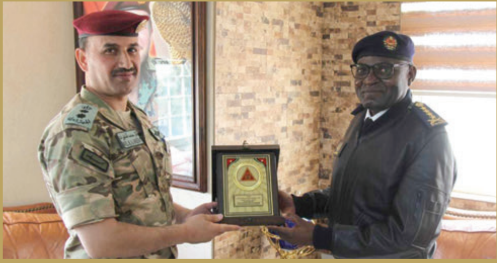
رئيس أركان الجيش الموزمبيقي يزور قيادة مجموعة الملك عبدالله الثاني القوات الخاصة الملكية