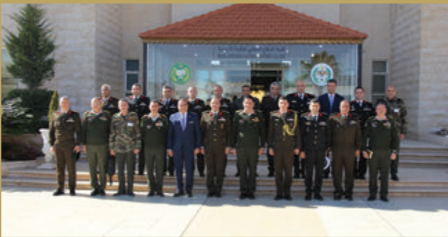
وفد عسكري مصري يزور كلية الدفاع الوطني