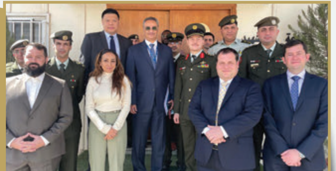
اجتماع تعاوني بين مديرية الأمن السيبراني وتكنولوجيا المعلومات ووكالة CECOM ومندوبين من السفارة لتعزيز الأمن السيبراني لمنظومة أمن الحدود