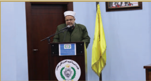
قيادة الحرس الملكي الخاص تحتفل بذكرى الإسراء والمعراج