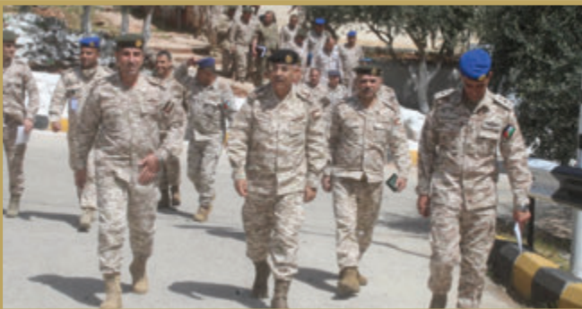
المفتش العام للقوات المسلحة يزور كتيبة الدفاع الجوي الميداني/٦١