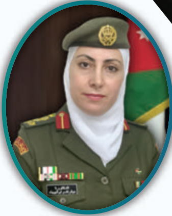
مستشار الامراض الجلدية