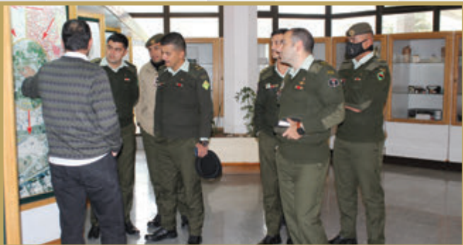
المركز الجغرافي الملكي يُقيم يوماً تدريباً لمدرسة الاستخبارات العسكرية