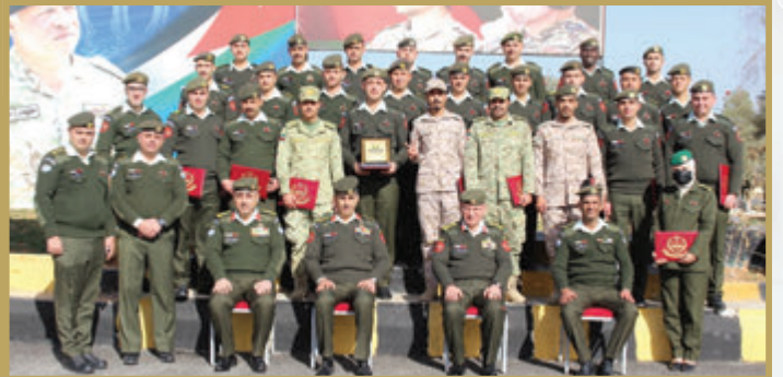
تفريج عدد من الدورات في كلية الشريف ناصر بن جميل للإتصالات