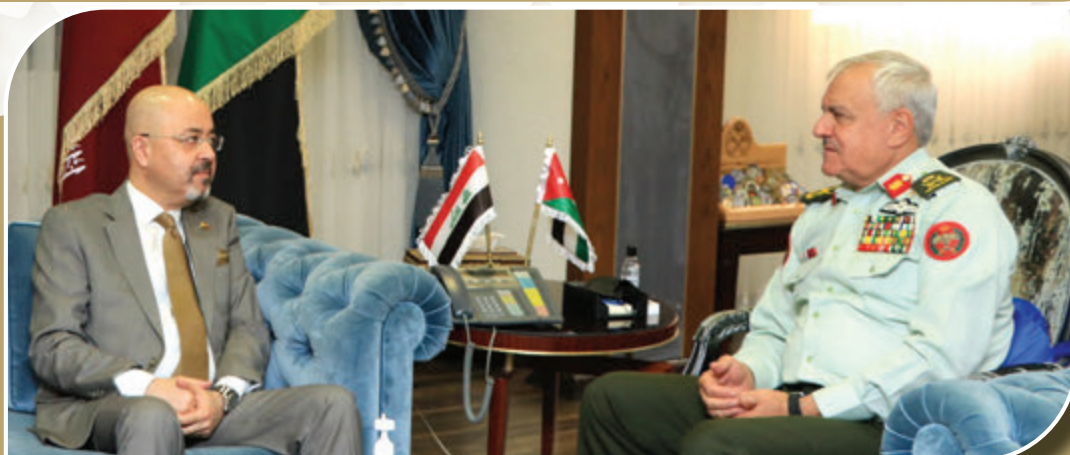
رئيس هيئة الأركان المشتركة يلتقي السفير العراقي حيدر منصور العذاري يوم الخميس الموافق ٧ نيسان ٢٠٢٢