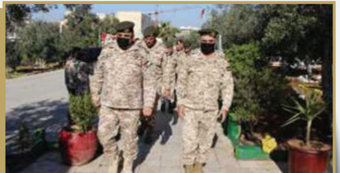
مكتب المفتش العام للقوات المسلحة يزور مجموعة النقل الإداري الثانية