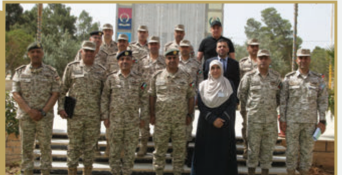
وفد طلابي من كلية الدفاع الوطني الملكية الأردنية يزور قيادة المنطقة العسكرية الشرقية