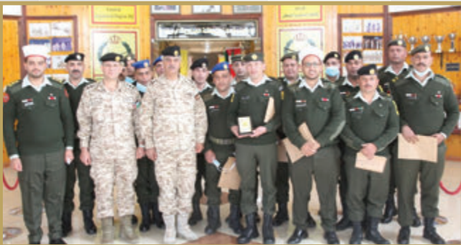
رئيس أركان المنطقة العسكرية الوسطى يُختم دورة حفظ القرآن الكريم في قيادة المنطقة