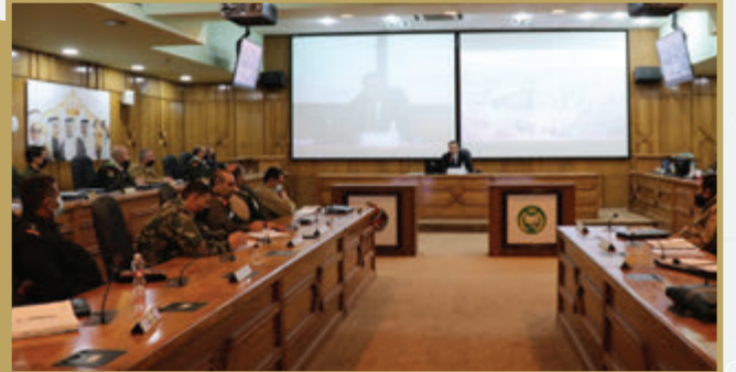
وزير السياحة والآثار يحاضر في كلية الدفاع الوطني