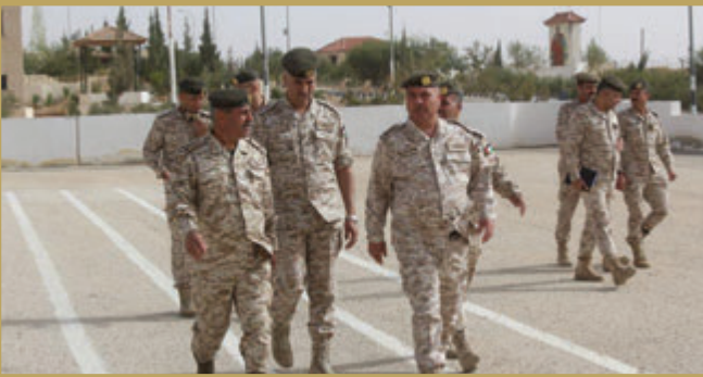
قائد المنطقة العسكرية الجنوبية يتفقد إحدى وحداتها