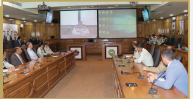
آمر كلية الدفاع الوطني يهنئ الطلاب بحلول شهر رمضان المبارك