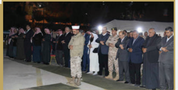
قيادة المنطقة العسكرية الوسطى تقيم مأدبة إفطار للمتقاعدين العسكريين بحضور المفتش العام للقوات المسلحة