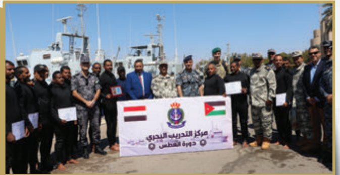
قائد القوة البحرية والزوارق الملكية يُخزّم دورة الغطس الخاصة بالأشقاء اليمنيين