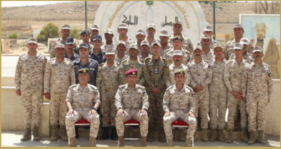
افتتاح دورة في مدرسة الشهيد الملك عبدالله بن الحسين للمشاة