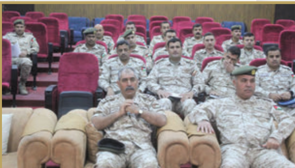
قائد المنطقة العسكرية الجنوبية يلتقي أركانها وحدات المنطقة