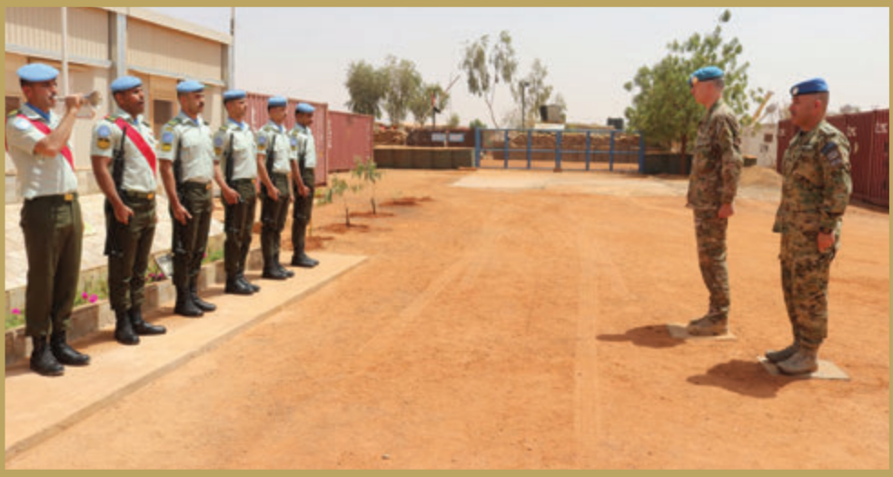
قائد القوة الدولية يزور قوة الإنتشار السريع الأردنية مالي/٢