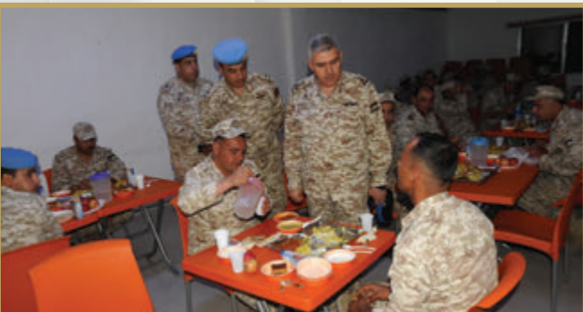
مدير سلام الهندسة الملكي يشارك مرتبات كتيبة هندسة الإسناد العام مأدبة الإفطار