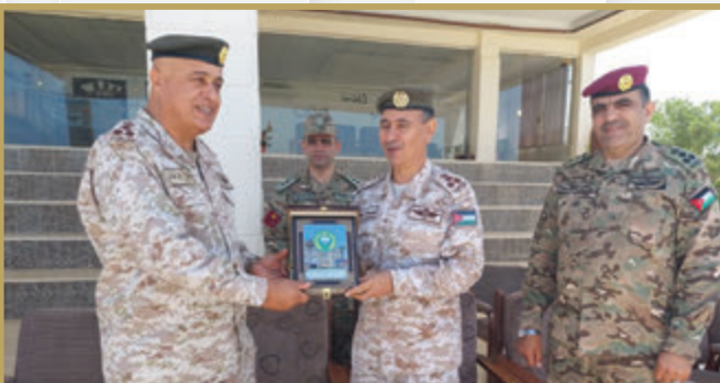
وفد من كلية الدفاع الوطني يزور واجهة المنطقة العسكرية الشمالية