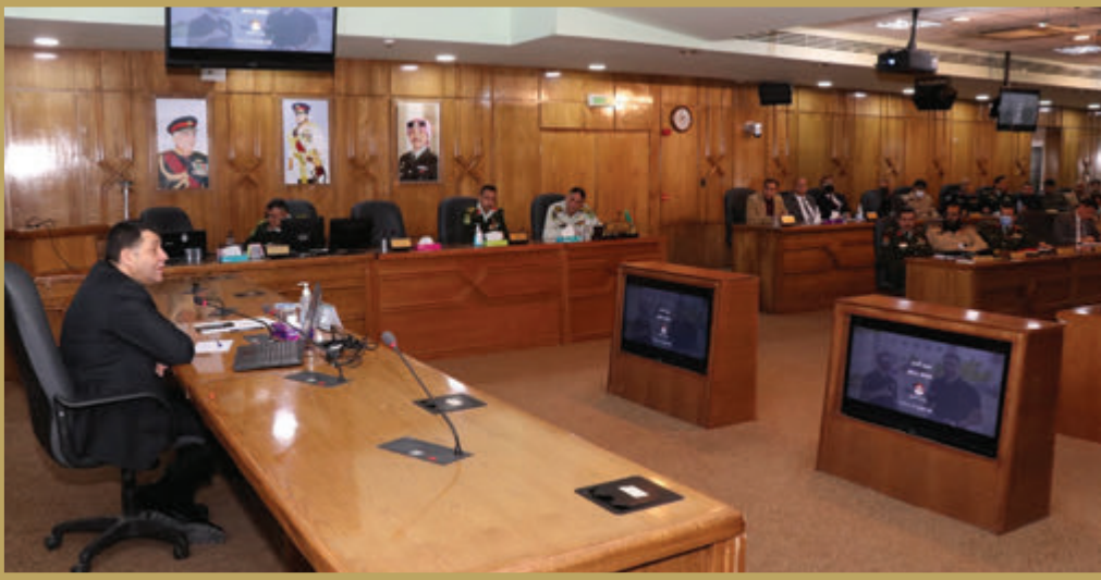
وزير العمل يحاضر في كلية الدفاع الوطني