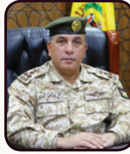
قائد المنطقة العسكرية الشرقية العميد الركن نجى المناصير :

وحسب تعليمات التدريب الصادرة عن القيادة العامة للقوات المسلحة الأردنية، خضعت قيادة المجموعة ووحداتها كافة، لبرامج تدريبية متنوعة تنسجم مع المتطلبات العملية والاستخباراتية، والتي شملت التدريب على العديد من المواضيع المتنوعة العملية والنظرية، بهدف رفع كفاءة واحترافية أداء مرتباتها، وما وصلنا إليه من مستوى عالٍ ومتميز في التدريب والإعداد، إنما بفضل الرعاية المستمرة من لدن جلالة القائد الأعلى للقوات المسلحة حفظه الله وأدامه لنا ذخراً وعزاً من خلال توفير كافة المهمات والمعدات والأسلحة الحديثة والمتطورة.