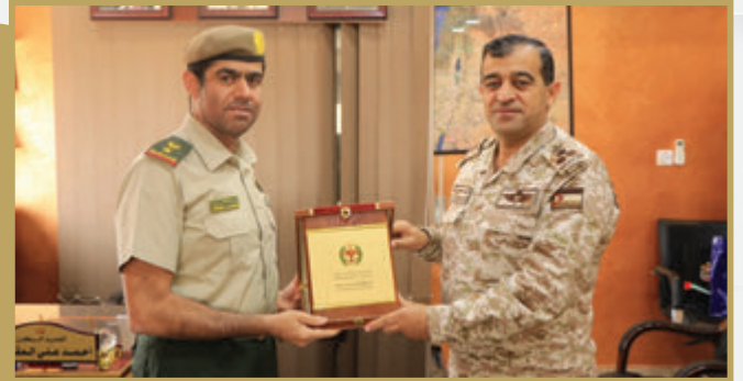
الملحق العسكري الإماراتي يزور مركز التخطيط المشترك والدروس المستفادة