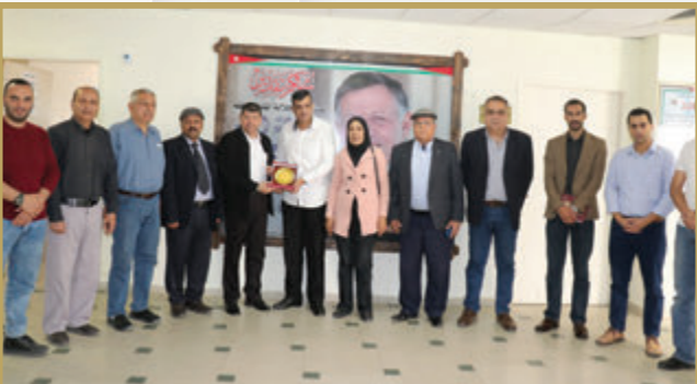
وفد التجمع الفلسطيني يزور للمستشفى الميداني غزة/٧