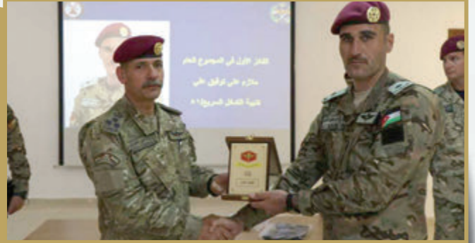
تخريج دورة اختبار الضباط (Selection course) في لواء سمو الشيخ محمد بن زايد آل نهيان/التدخل السريع