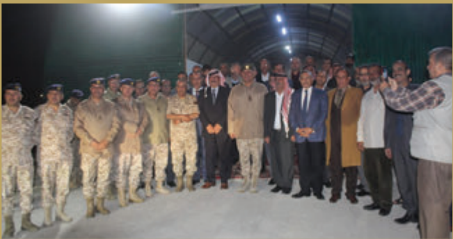
قيادة سلام المدفعية الملكي تقيم مأدبة إفطار للمتقاعدين العسكريين والمصابين وذوي الشهداء