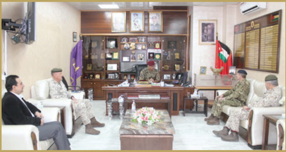
وفد عسكري بريطاني يزور الكلية العسكرية الملكية