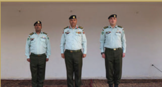
قائد لواء الملك حسين بن علي يرعى تخريج دورة المستجدين