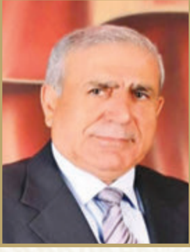
اللواء الركن المتقاعد الدكتور صالح لافي المعايطة