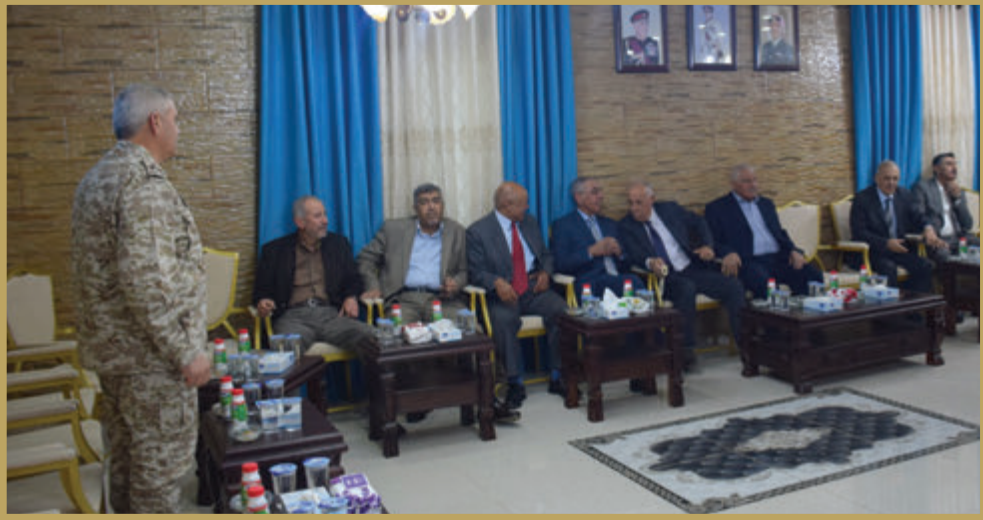
مديرية سلام الهندسة الملكي تقيم مأدبة إفطار للمتقاعدين العسكريين