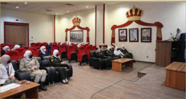
محاضرة بعنوان الرعاية الدينية والروحية للمرضى في مرحلة الإحتضار في مديرية الخدمات الطبية