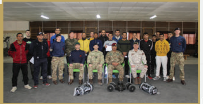
أمر الكلية العسكرية يُخرّج دورة التدريب البدني