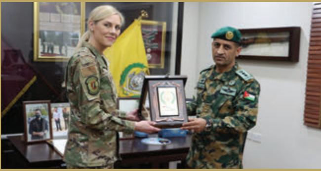
وفد عسكري أمريكي يزور قيادة الحرس الملكي الخاص