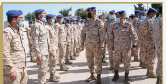
مدير الدفاع الجوي الميداني الملكي يتفقد مجموعة الدفاع الجوي الميداني /١٢ الملكية