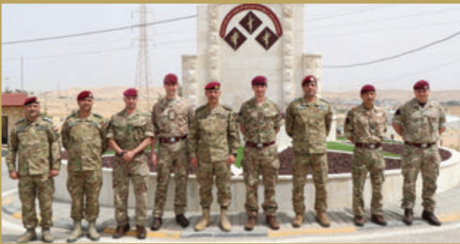
وفد عسكري بريطاني يزور لواء سمو الشيخ محمد بن زايد آل نهيان/التدخل السريع