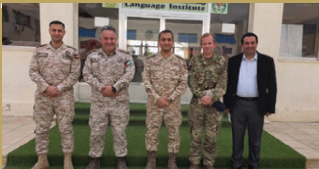
الملحق الجوي والبحري البريطاني يزور معهد اللغات