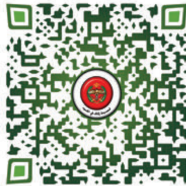
قصيدة زفاف في الحدود