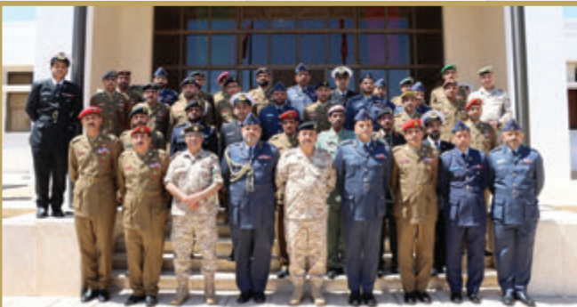
وفد عسكري عُمانِي يزور كلية القيادة والأركان