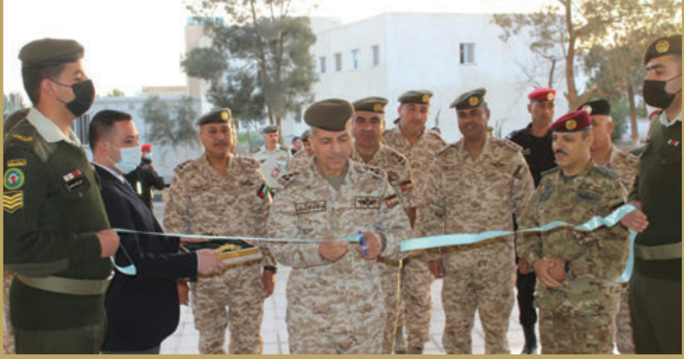
المساعد للعمليات والتدريب يفتتح مجعاً إدارياً في مديرية أمن وحماية المطارات