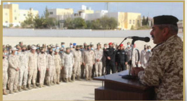
قائد المنطقة العسكرية الجنوبية يحاضر مرتباتها