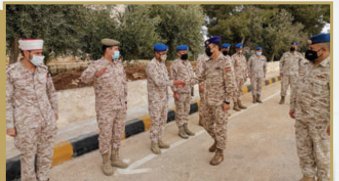
مدير الدفاع الجوي الميداني الملكي يزور قيادة لواء الدفاع الجوي الميداني /٤ الملكي