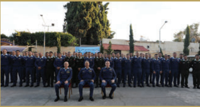
تخريج دورة القيادة والأركان الصغرى رقم (١٠١) في قيادة سلاح الجو الملكي