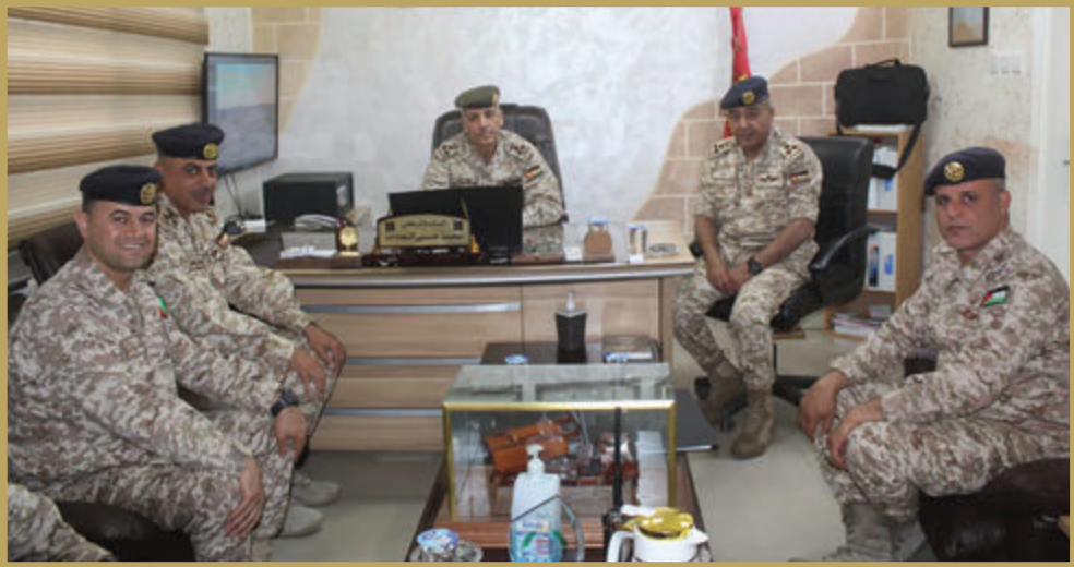
المساعد للعمليات والتدريب يزور كتيبة الراجمات/ ٢٩ الملكية