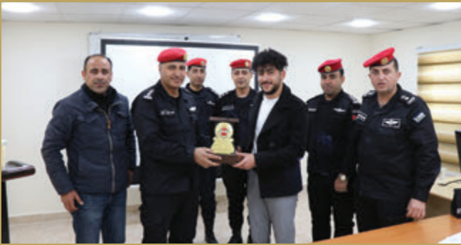
قيادة الشرطة العسكرية تُكّرم عدد من ذوي الشهداء