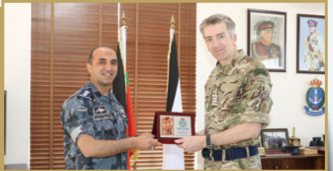
وفد عسكري بريطاني يزور قيادة القوة البحرية والزوارق الملكية