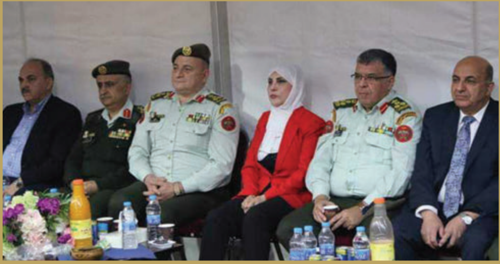
الخدمات الطبية الملكية تقيم مأدبة إفطار لمتقاعديها