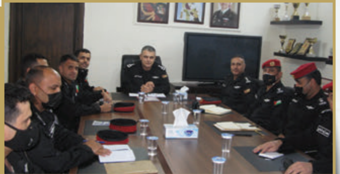
اجتماع تنسيقي في قيادة الشرطة العسكرية الملكية