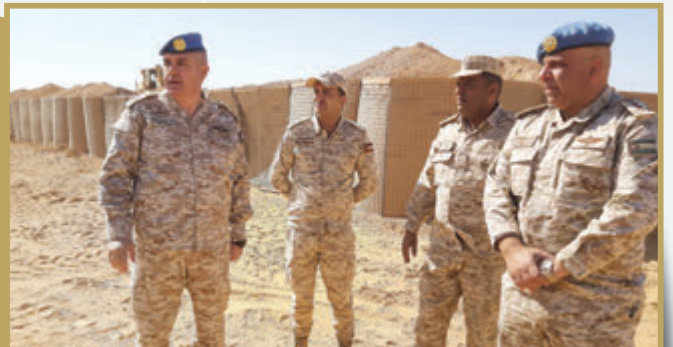
مدير سلام الهندسة الملكي يتابع مشروع قرية أبو سالم