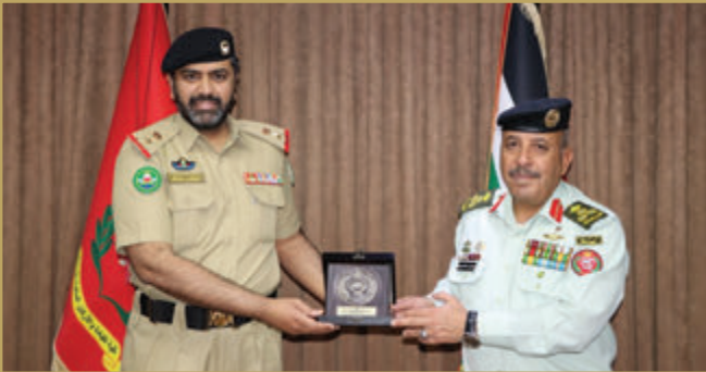
الملحق العسكري البحريني يزور كلية القيادة والأركان