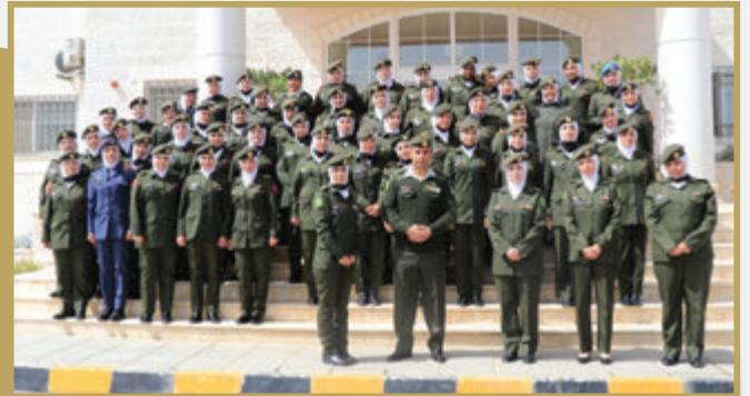
تفريج دورة الوكلاء الخاصة بالتفريع لرتبة ملازم في مركز تدريب المرأة العسكرية