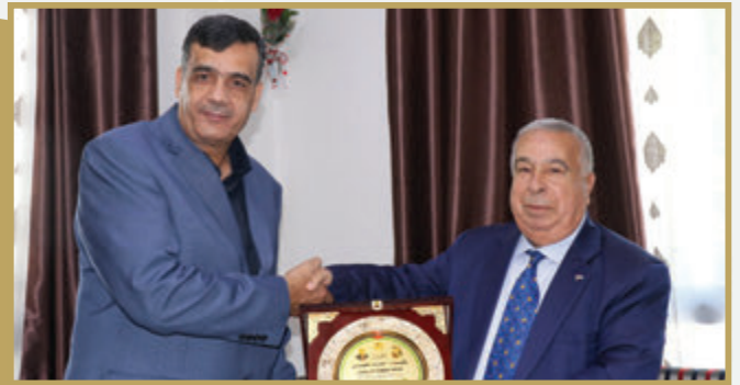
مستشار الرئيس الفلسطيني للشؤون الصحية يزور المستشفى الميداني الأردني/٧