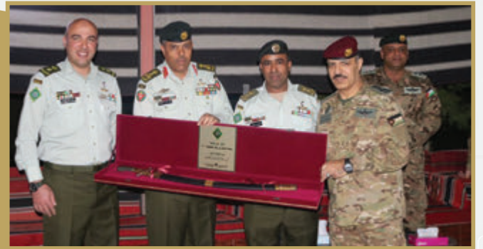
قائد لواء الملك حسين بن علي يكرم قائد وحدة طارق بن زياد / ٢