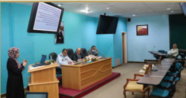
آمر كلية الدفاع الوطني يتابع مناقشة رسائل الماجستير في الكلية