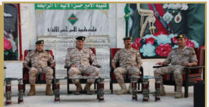
المساعد للإدارة والقوى البشرية يشارك كتيبة الأمير حسن الآلية/ ٤ مأدبة الإفطار