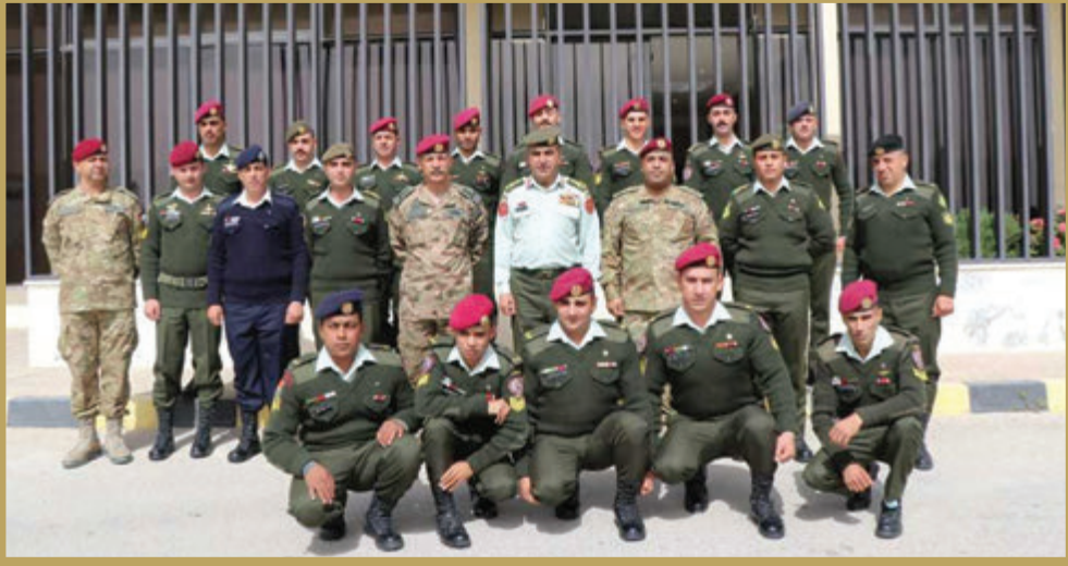
تخريج دورة الإسناد الجوي القريب (مركز النيران المشتركة) في لواء سمو الشيخ محمد بن زايد آل نهيان/التدخل السريع