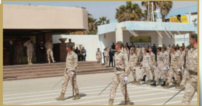
بدء البروفات التحضيرية لحفل تخريج فوج مؤتة الثاني والثلاثين