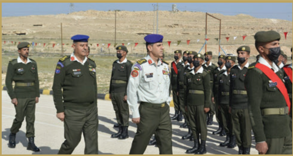
مدير الدفاع الجوي الميداني الملكي يُخرّج دورة المستجدين في مدرسة الدفاع الجوي الملكي