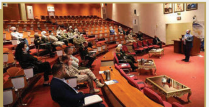
مديرية الصيدلة والتزويد الطبي تعقد ورشة عمل بعنوان «العناية بالفتحات الجانبية والجروح»