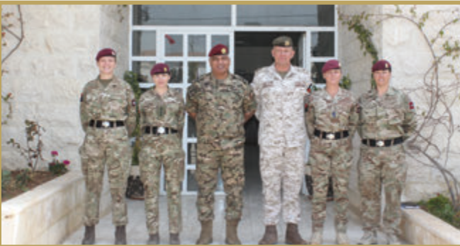
أمر الكلية العسكرية الملكية يُكرّم مدرّبات من الجانب البريطاني