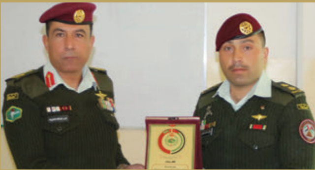
تخريج عدد من الدورات في مدرسة الشهيد الملك عبدالله بن الحسين للمشاة