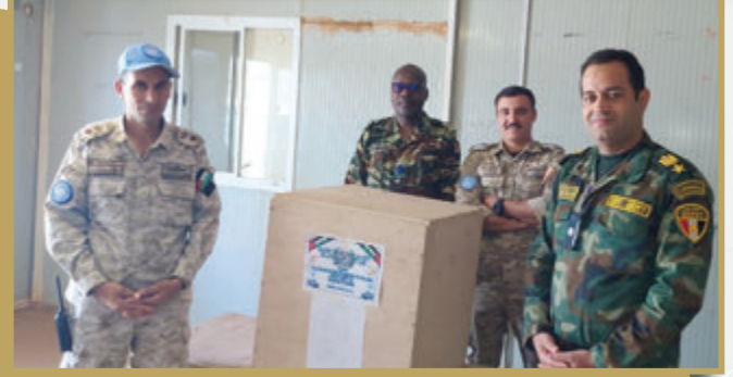
قوة الإنتشار السريع الأردنية مالي/٢ توزع مساعدات إنسانية وطبية وغذائية على المجتمع المحلي