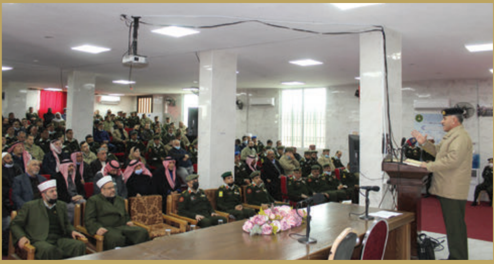
المساعد للإدارة والقوى البشرية يودّع بعثة العمرة في كلية الأمير الحسن للعلوم الإسلامية