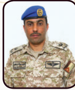
قائد سرية الدفاع الجوي الميداني /ه صواريخ كتف الرائد خلف العظامات:

المسؤولية، من خلال صواريخ قصيرة المدى تستخدم لحماية العمق والمناطق الحيوية والمناطق العسكرية، وحماية القوات العسكرية في الميدان، بالإضافة إلى منع عمليات التسلل والتهريب على واجهة المنطقة، من خلال سرية دبابات شيلكا التي تقوم بمشاغله وتدمير الأهداف الأرضية والجوية (الطائرات المسييرة)، وخلال أزمة كورونا شاركت الكتيبة مع مرتبات قيادة المنطقة العسكرية الشرقية من خلال وضع نقاط غلق ضمن منطقة المسؤولية.