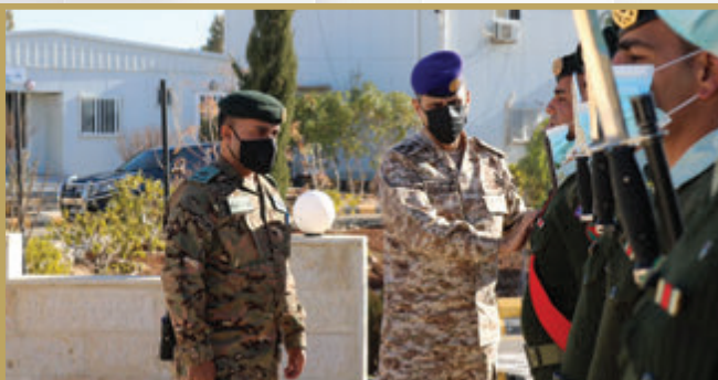
مدير الدفاع الجوي الميداني الملكي يزور كتيبة الدفاع الجوي الميداني /١٤ الملكية