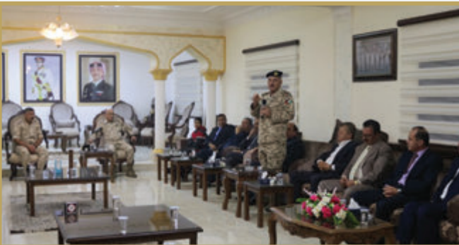
المساعد للإدارة والقوى البشرية يشارك المتقاعدين العسكريين مأدبة الإفطار في قيادة المنطقة العسكرية الشمالية