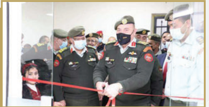
مدير عام الخدمات الطبية الملكية يفتتح وحدة التصلب اللويحي