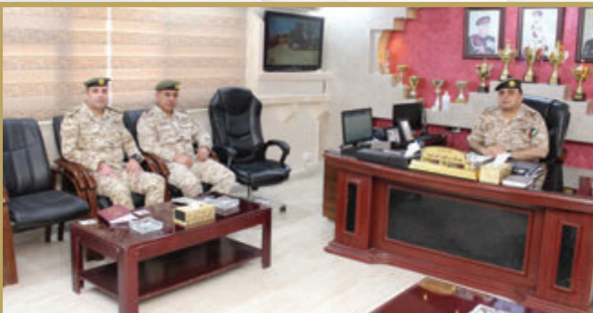
مدير التموين والنقل الملكي يتفقد مجموعة المخابز العسكرية