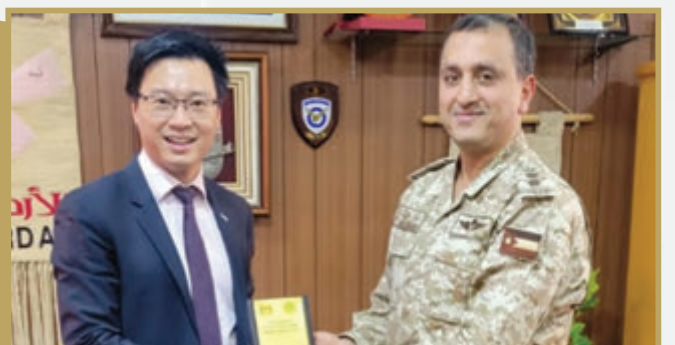
المدير العام الإقليمي يزور المجلس الثقافي البريطاني لمعهد اللغات